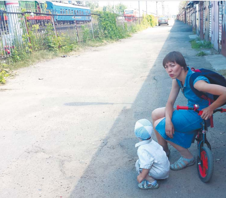
Пока идёт поезд, можно немного отдохнуть в тени...