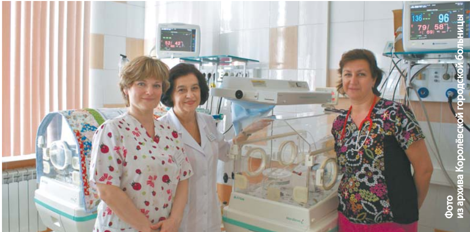
Коллектив Королёвской больницы пополнится новыми кадрами