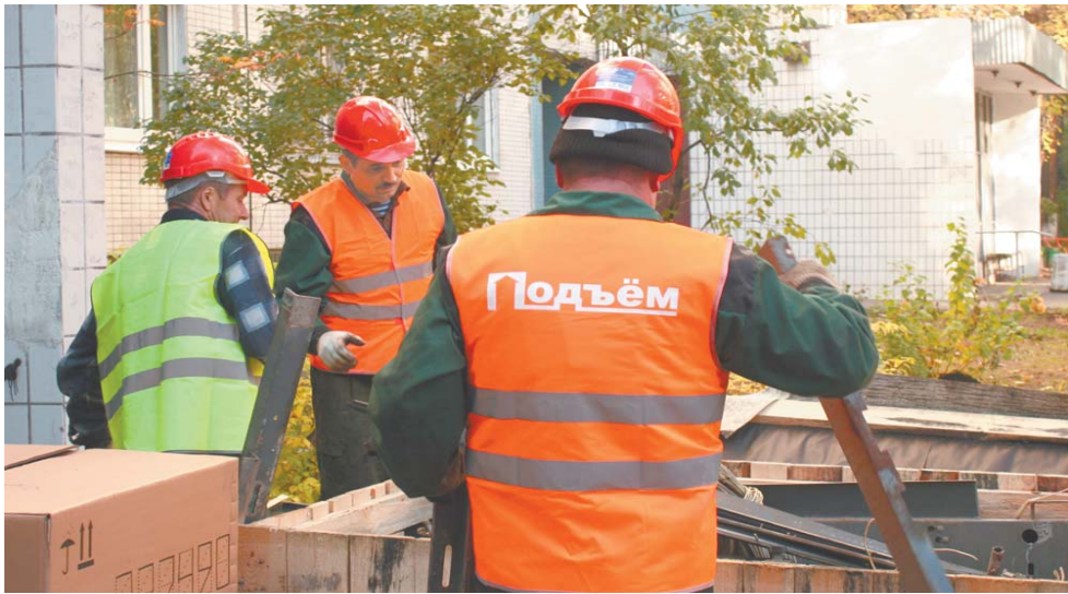
В 2016 году должны быть заменены 87 устаревших лифтов

На встречах люди часто просят информировать о том, когда их дом может быть включён в график капитального ремонта. Если говорить вкратце, то в рамках капитального ремонта многоквартирных домов ремонтируют фасады, крыши домов, инженерные системы и оборудование, внутридомовые места общего пользования, служебные и технические помещения, а также проводят благоустройство территорий домовладения. За 2014–2016 годы на капитальный ремонт общего имущества многоквартирных домов в Королёве было выделено более 730 млн руб. Но в период с 2010 по 2013 годы на те же