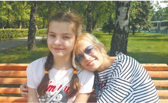
Под ласковым солнышком, рядом с мамой... хорошо