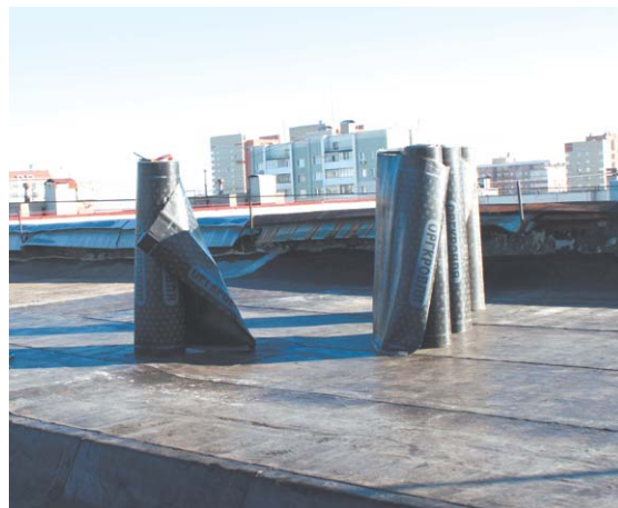
Ремонт кровли – обязательный элемент капремонта

– Фонд капитального ремонта существует уже два года, и наша задача – подвести промежуточные итоги и убедиться, что программа реализуется. Важно, чтобы план по капитальному ремонту был доведён до тех, кто его очень ждёт, – подчеркнул Андрей Воробьёв. – Не только программа 2016 года, но и дальнейшие перспективы должны быть понятны жителям.