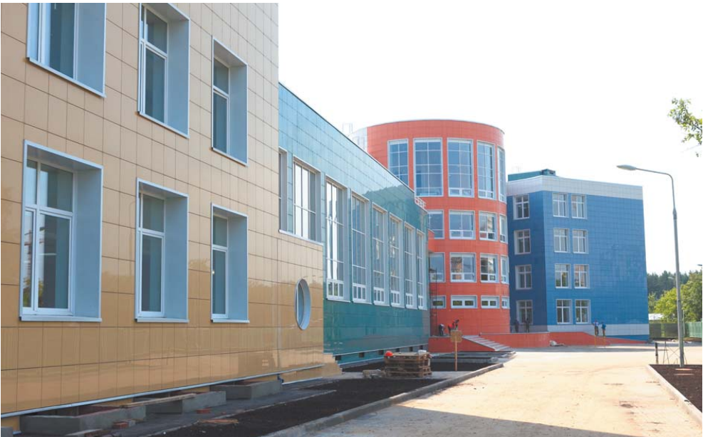
Новая школа на ул. Пионерской в Королёве

– До конца этого года мы сдаём 25 школ, 14 из них – до 1 сентября. С 2014 по 2016 годы в Подмосковье построено 55 школ, в госпро-