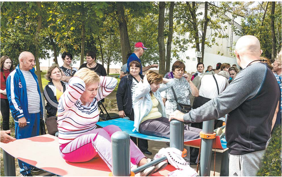
Нормы ГТО сдавали королёвцы всех возрастов