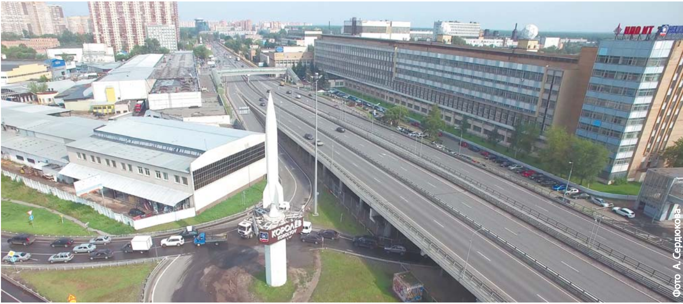
Въезд в город теперь свободен от «пробок»