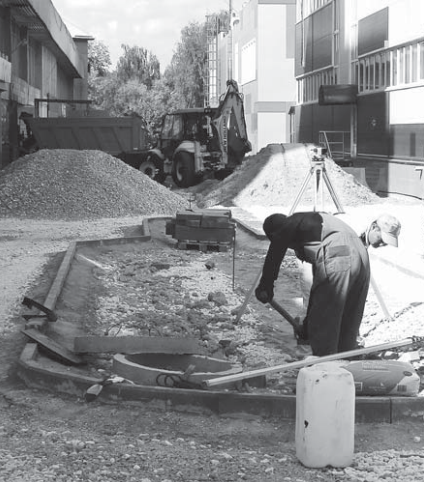
Ул. Тихонравова преобразится

В РАМКАХ ПРОГРАММЫ «ПЕШЕХОДНЫЕ УЛИЦЫ ПОДМОСКОВЬЯ» в каждом муниципалитете региона проводятся работы по созданию улиц, свободных от движения автотранспорта. По просьбам жителей Королёва в нашем городе в качестве пешеходной зоны решили обустроить участок улицы Тихонравова в мкр Юбилейном.