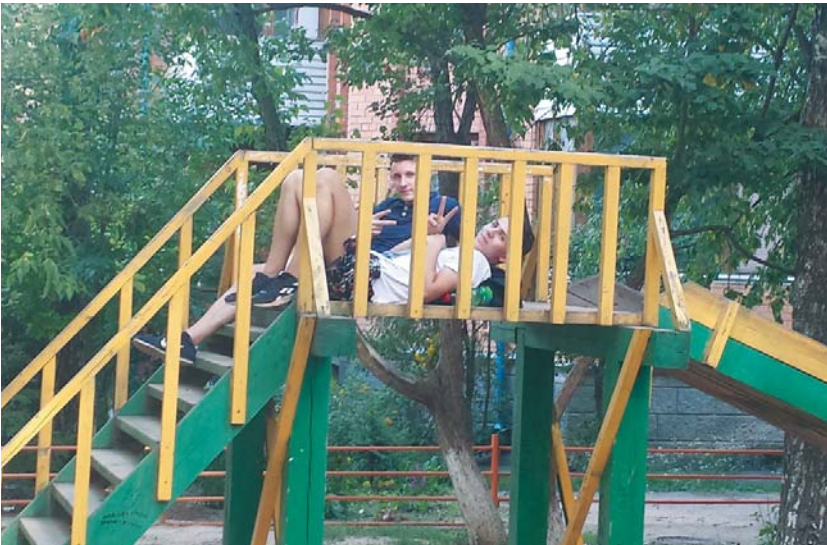
Полдень совсем разморил... Тише, «дети» спят!