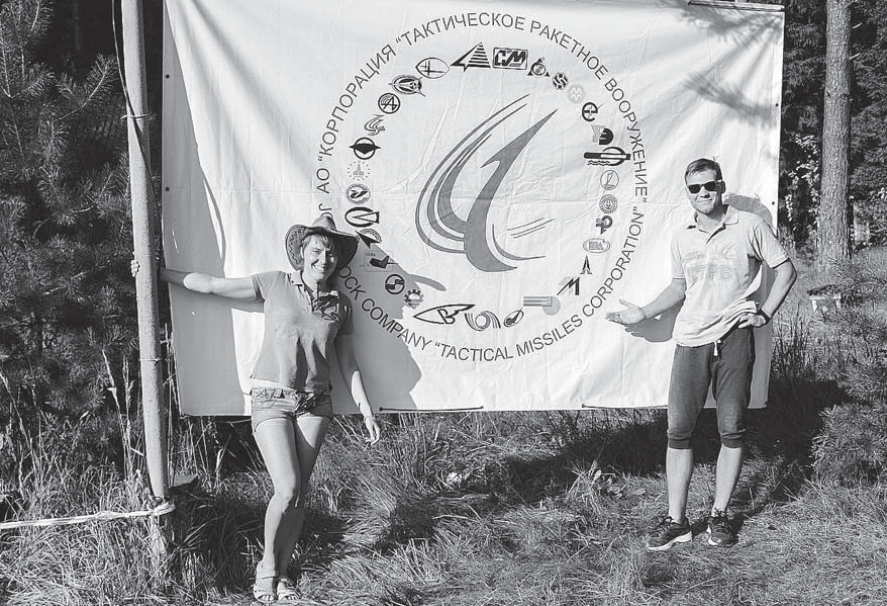
На слёте молодых работников «КТРВ»

Уже на следующее утро ребята участвовали в соревнованиях по Арчери Таг (безопасному лучному бою), другие же в это время играли в настольные игры, занимались йогой или рисовали татуировки.