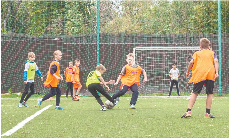
Борьба за кубок ПИФ

на «Металлист» совсем юные спортсмены сражались в очередном этапе ежегодного кубка ПИФ (Пацанов, Играющих в Футбол). 16 дворовых команд играли в двух возрастных командах. Ребята, хоть пока и не обладают мастерством, но зато показали всем настоящий игровой азарт и любовь к спорту. Стоит отметить, что играли также и команды девочек. Но отдельно. В этот праздник спорта, к тому же, закончился и розыгрыш Летнего первенства города Королёва по футболу. Всё лето на