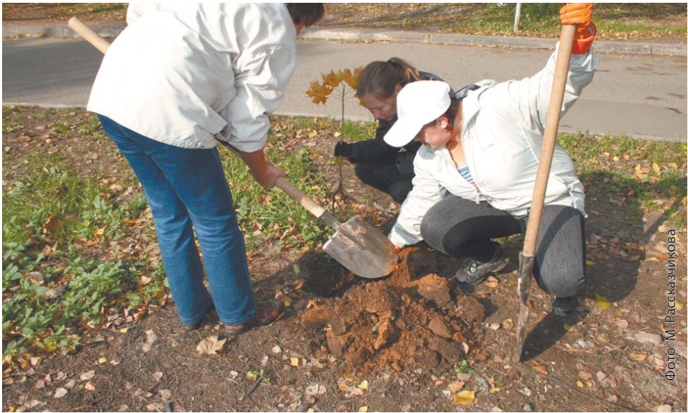
Акции по посадке деревьев находят отклик у королёвцев

Власти Московской области обеспечат участников акции «Наш лес. Посади своё дерево» всем необходимым, ничего принести с собой дополнительно им не понадобится.