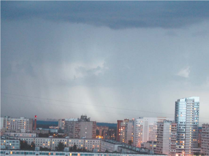
Вот подходит гроза, о силе которой горожане даже не подозревают...