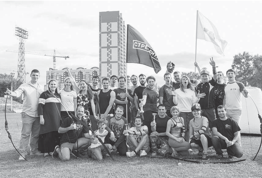
Участники турнира по Арчери Таг

20 августа в 11 часов во дворе дома по ул. К. Маркса, д. 6 состоялся баскетбольный турнир между дворовой командой и командой активистов «Единой России». Турнир приурочен к Всероссийскому дню дворового спорта.